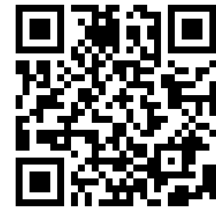
初回ログインページ